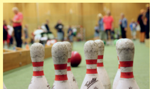
Bowling var en annan populär aktivitet.